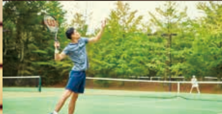
富士 Marriott ホテル 山中湖 テニスコート