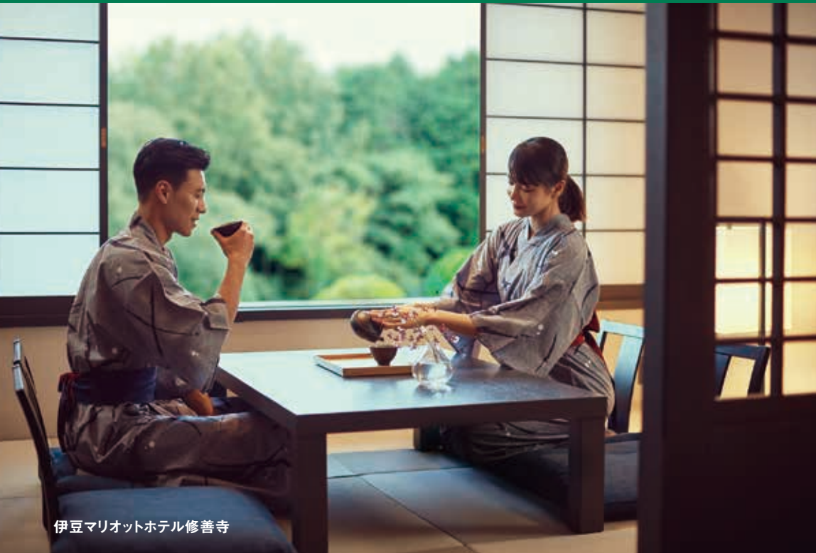
伊豆 Marriott ホテル 修善寺