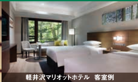
軽井沢 Marriott ホテル 客室例