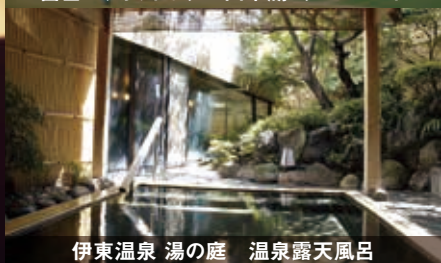
伊東温泉 湯の庭 温泉露天風呂